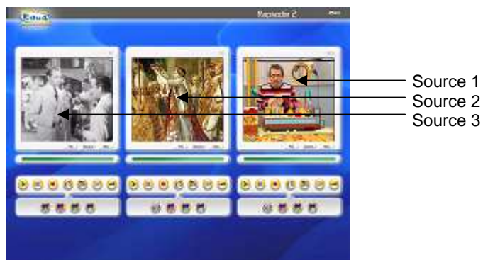
Tableau de commandes associé à chaque source :

Affichage des sources analogiques et numériques